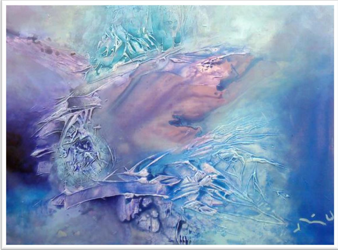
ALEPH 7 - Técnicas Mixtas sobre Tela | Juan Rodríguez Uribe 2011